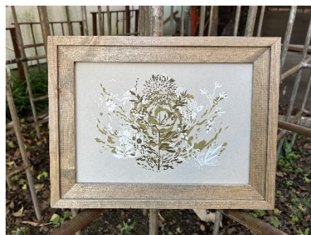
展示・販売作品(一例)