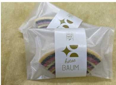
【「めい姫の十二単バウム」イメージ】