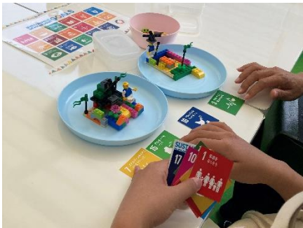
【ワークショップ イメージ】