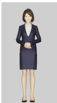
サイバーマルチタレント

人工知能 ATHEUS®が生成した3Dコミュニケーションアバター。距離や性別、個性を超えた存在としての空間に生きる世界を実現します。