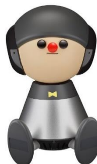
Charlie (チャーリー) コミュニケーションロボット

話しかけると、ミュージカルのように歌って答えてくれる AI ロボット。人とロボットの気持ちが通ずるコミュニケーションを実現します。