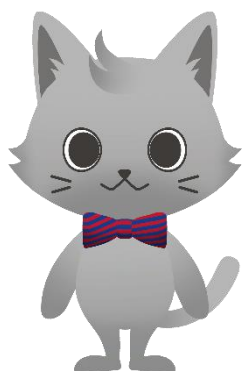
【アバター先生 イメージ】