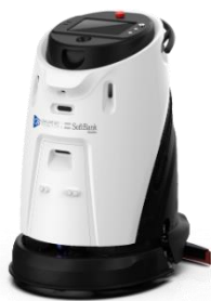
Scrubber 50 Pro