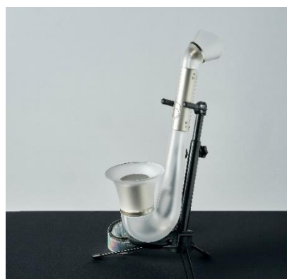
【ウルトラライトサクソ イメージ】

ギターやピアノのようなコード(和音)を両手の指1本ずつで弾ける楽器です。簡単だけでなく遊んでいるうちにコード理論も身につく優れたものです。