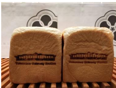
【「高輪ゲートウェイ駅限定 焼印入本食パン」イメージ】