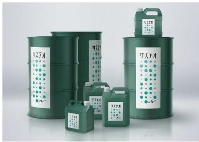
【次世代バイオ燃料 イメージ】