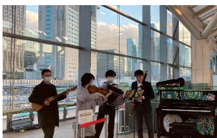
【演奏風景 イメージ】