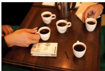
【コーヒーセミナー イメージ】