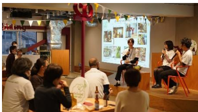
【乾杯イベントの様子】