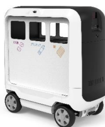
ゴミ箱 AMR (Autonomous Mobile Robot)

商業施設やテーマパークなど、屋内外において規定経路を自律走行・巡回しゴミを収集します。自己位置認識・衝突防止機能を持つ自律移動ロボット。