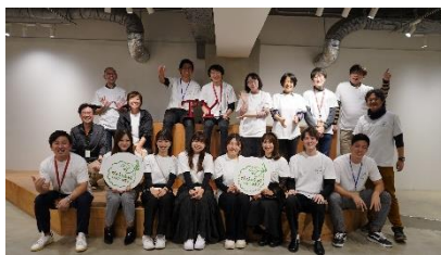
【コミュニティメンバー】