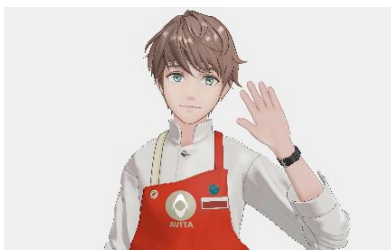
【接客アバター イメージ】