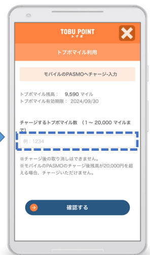
TOBU POINTにログインしてチャージ金額を入力