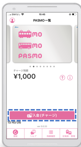
PASMOアプリを起動して「入金(チャージ)」を選択

<PASMOアプリで「トブポマイル」をモバイルのPASMOへチャージする際の操作イメージ>