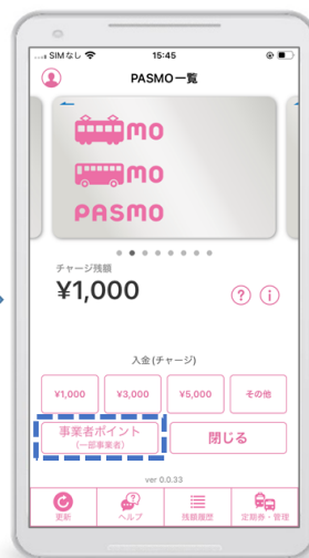
入金(チャージ)画面で「事業者ポイント」を選択