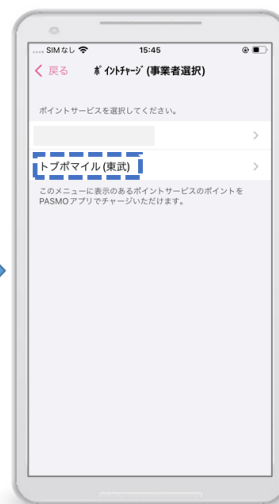
ポイントサービス選択画面で「トブポマイル」を選択