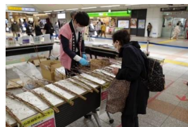
「桃の花枝」配布(イメージ)