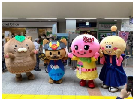
ご当地キャラクターによる観光 PR

(※写真は2022年7月開催「やまなしフェア@八王子駅」で撮影されたものです。)