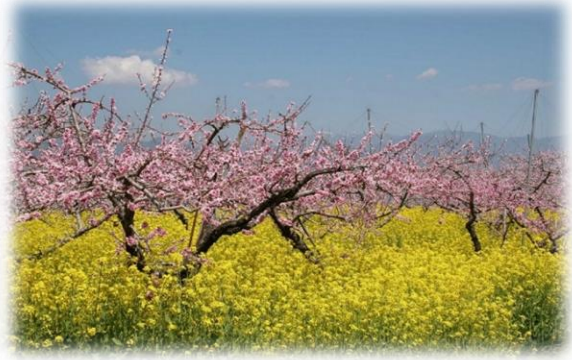
桃の花と菜の花（笛吹市）