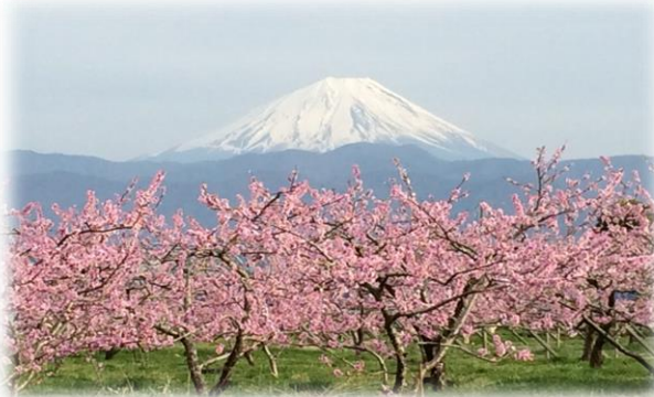
桃の花と富士山（南アルプス市）

春の山梨は桃の花で桃色一色に染まり、桃源郷とも呼ばれます。是非産直市で春の山梨を感じていただき、そして実際に山梨に赴き山梨の魅力を味わってください。