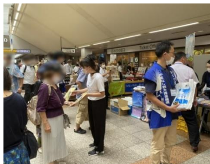
パンフレット配布・観光 PR

(※写真は2022年7月開催「やまなしフェア@八王子駅」で撮影されたものです。)