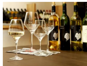
山梨県のワイン(イメージ)