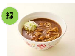
①至福のカレーそば （単品600円）