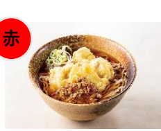
②まぐろ担々天ぷらそば （単品650円）