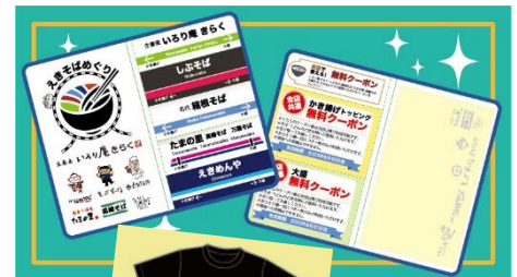
（上）配布予定の付箋 （下）特製Tシャツ

株式会社小田急レストランシステム（本社：東京都渋谷区）、京急ロイヤルフーズ株式会社（本社：東京都大田区）、株式会社JR東日本クロスステーション（本社：東京都渋谷区）、株式会社東急グルメフロント（本社：東京都目黒区）、株式会社レストラン京王（本社：東京都府中市）の5社は、2023年2月22日（水）から同年3月31日（金）まで各社が運営する駅そば業態において「えきそばめぐり～駅そばシールラリー～」を初めて共同開催します。