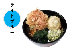
⑤桜海老のミニかき揚げ天と ドデカ肉団子天そば （単品620円）