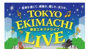
東京エキマチライブ