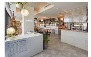
しんおおくぼ Kitchen&Bar チカバ

○内 容： 駅直上にあるビルの3階に誕生した食堂 & 食関連のイベントスペース。 しっかりとしたご飯から、こだわりのデザートやドリンク等が揃います。 HAND! や新大久保巡りのちょっとした休憩に是非ご利用ください。