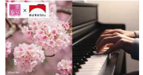
駅ピアノ in UENO