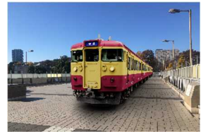
AR TRAIN PROJECT