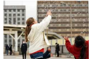
パンダバシピクニック