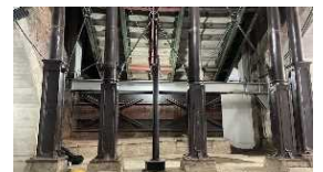
新橋駅工事ヤード