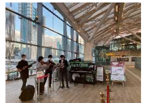
Music Space in Spring