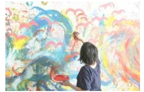
出展作品イメージ