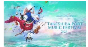
TAKESHIBA PORT MUSIC FESTIVAL