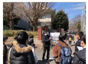
上野アートクロスまちあるき