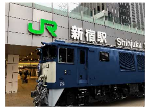
AR TRAIN PROJECT