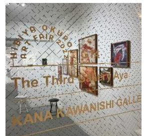
日比谷 OKUROJI アートフェア2022 (開催時)