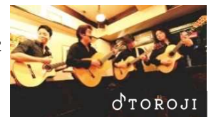
Gipsy Groove Live