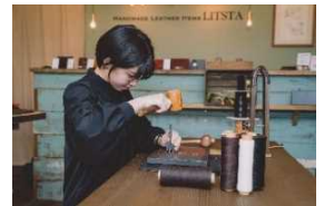
2k540 クリエイティブ DAY!