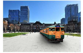
AR TRAIN PROJECT

※東京駅・新宿駅・上野駅のうちいずれかの駅でARを体験され、写真をご提示いただくと、オリジナルポストカードをお渡しします。(数量限定) 引換期間:3月3日(金)～6日(月)10時～21時 引換場所:秋葉原駅昭和通り口改札外「GENERAL STORE RAILYARD」