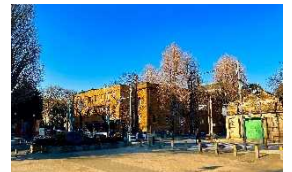
歴史と文化を感じるツアー