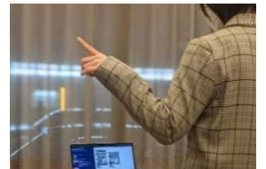
サウンドアート体験

○内 容： 音楽の知識がなくても、誰もが音楽を奏でる楽しみを味わえる体験。 「うごく・まつ・とまる」というシンプルなかからだの動きから生まれる一期一会の 音を感じていただけます。