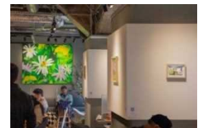
ToMoRow Gallery 店内

○内 容： 高田馬場駅「ToMoRow Gallery」はアートが買える、駅のカフェです。 移りゆくアートとともに、カフェでのひと時をお楽しみください。