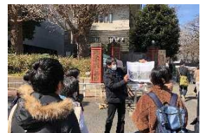
駅とまちで感じるアートツアー