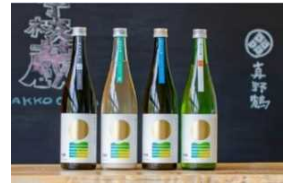
SLOW NEIGHBORHOOD BAR (商品一例)

○内容：東京で暮らす中で、ほとんど知らない地方の暮らしとの出会いと交流を育む場所。日本各地の逸品を提供するほか、毎週土曜日は食を通じた地域との出会いと可能性を紹介するイベント等も開催します。