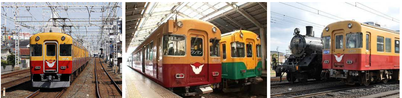
3社の旧3000系特急車（左から京阪電車・富山地鉄・大井川鐵道）