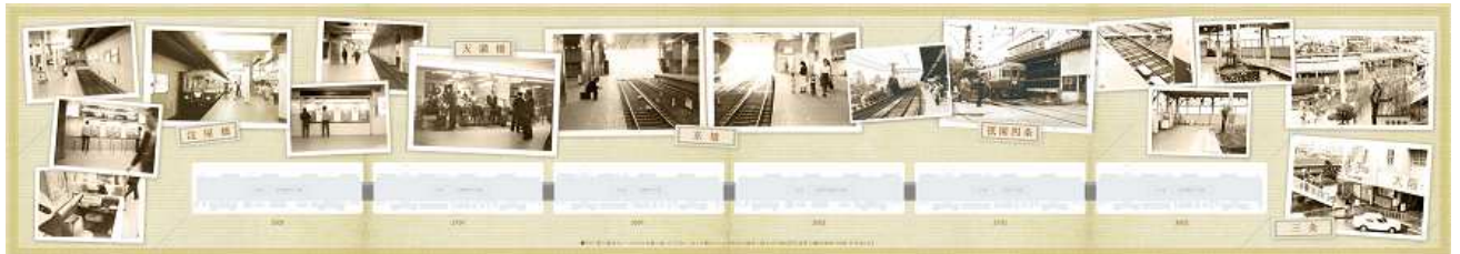
ラリー駅で進呈するシール